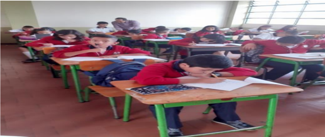
Colegio Metropolitano María Occidente - Popayán 10 de marzo de 2020.