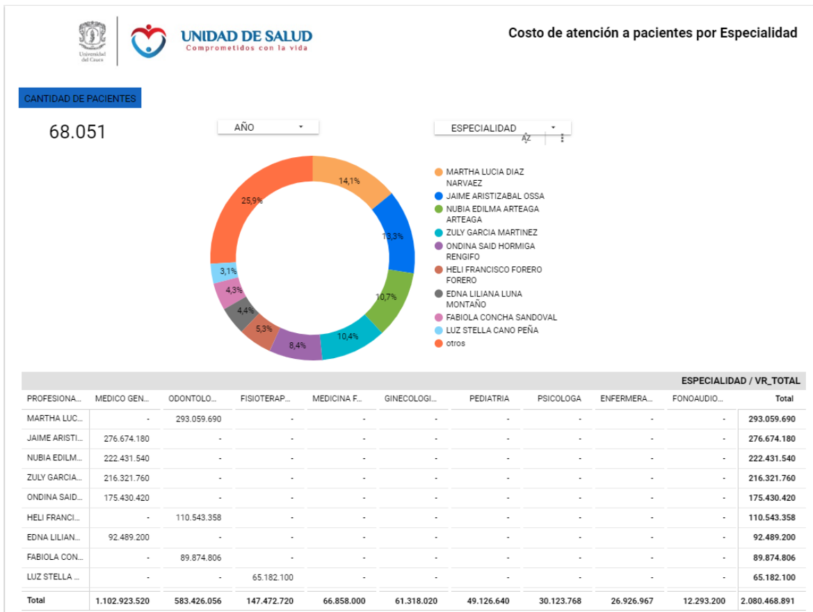
Figura 6: Dashboard Costo de atención a pacientes por especialidad - Tomada dashboard

De acuerdo a la Figura 6, es posible observar los 10 primeros médicos que más han atendido consultas y por ende se verá reflejado en los reportes financieros para la entidad de salud, de tal modo que se aprecia claramente se ve que la especialidad de odontología es la que más factura. Este y otros patrones pueden resultar sumamente útiles para que la unidad de salud tome acciones preventivas y correctivas en el ámbito de la salud