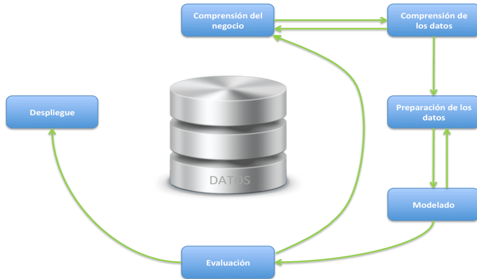
Figura 1. Ciclo de vida de minería de datos