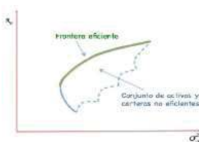
Gráfico 1. Frontera Eficiente

muestra como una alternativa de fácil aplicación donde se carga la consolidación de la información histórica, de los costos de los instrumentos objetos de estudio en este caso siendo de renta fija ajustados al perfil de la empresa, además por la trayectoria encontrada en el portafolio actual y las tendencias de inversión que la misma presenta en la continuidad de los instrumentos financieros; seguido por el desarrollo matemático del modelo, por otra parte, el inversionista puede obtener un escenario donde conocerá el porcentaje en el que se refleja de forma eficiente la colocación de la cantidad de dinero o posible combinación de los activos para optimizar la inversión.