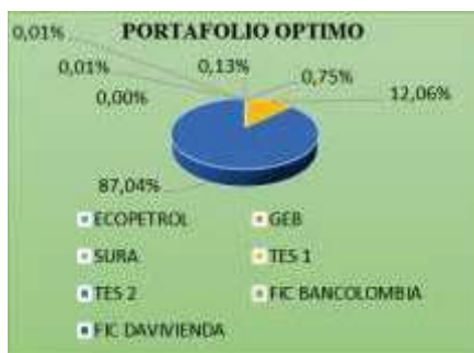
Gráfico 3. Participaciones portafolio optimo