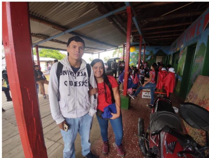
FOTOGRAFÍAS 4. PREPARACIÓN DE RITUAL DE MEMORIA HISTÓRICA EN EL RESGUARDO INDÍGENA KITE KIWE, ZONA RURAL DEL MUNICIPIO TIMBÍO, CAUCA.