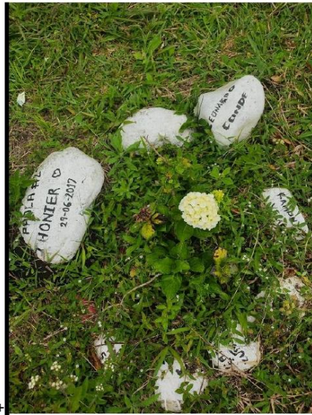
FOTOGRAFÍAS 1. PIEDRAS PINTADAS DE BLANCO CON LOS NOMBRES DE LAS VÍCTIMAS DE LA MASACRE UBICADAS ENTRE EL JARDÍN DE LA MEMORIA Y LA TULPA DEL RESGUARDO INDÍGENA DE KITE KIWE