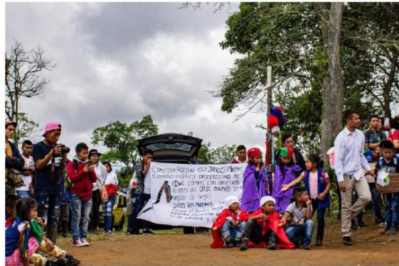
FOTOGRAFÍAS 5. CELEBRACIÓN DEL RITUAL DE MEMORIA HISTÓRICA RESGUARDO INDÍGENA KITE KIWE. ZONA RURAL TIMBÍO, CAUCA.