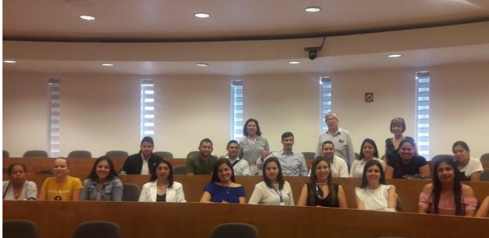
Ilustración 8. Conferencia Universidad Iberoamericana.