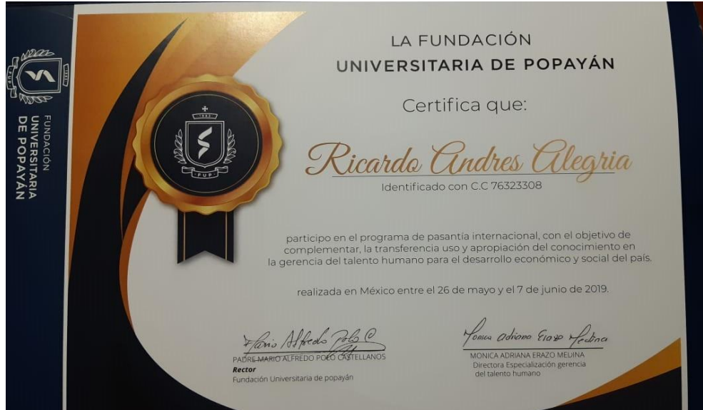
Ilustración 4. Certificación Pasantía Internacional.

FUNDACIÓN UNIVERSITARIA DE POPAYÁN 35 ANIVERSARIO