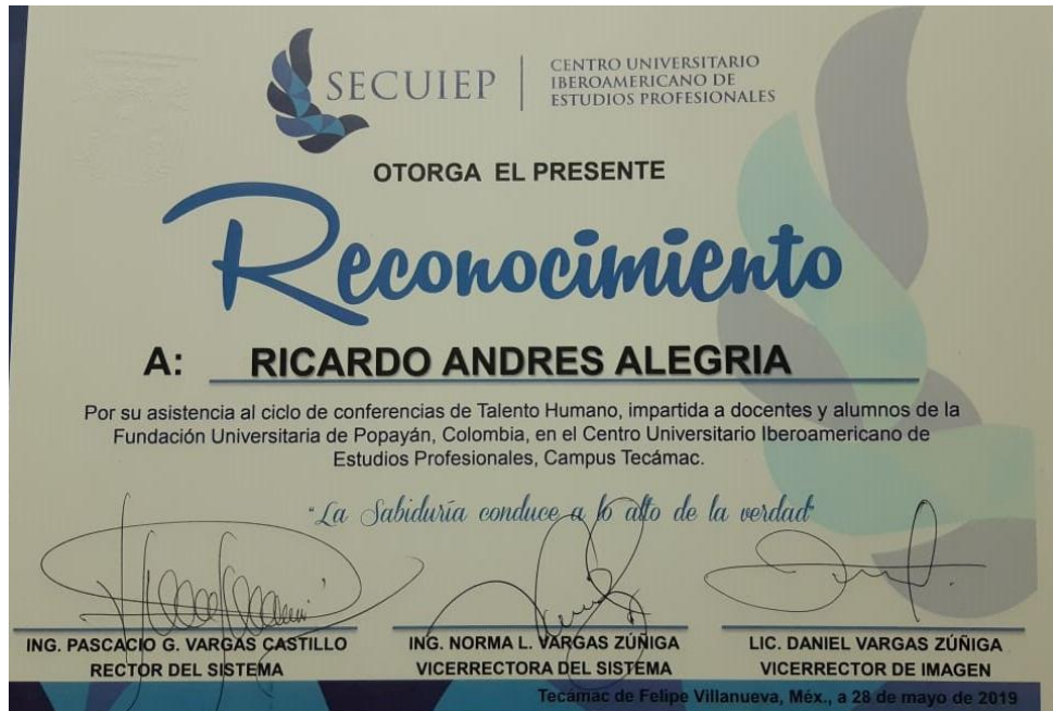
Ilustración 5. Reconocimiento SECUIEP.