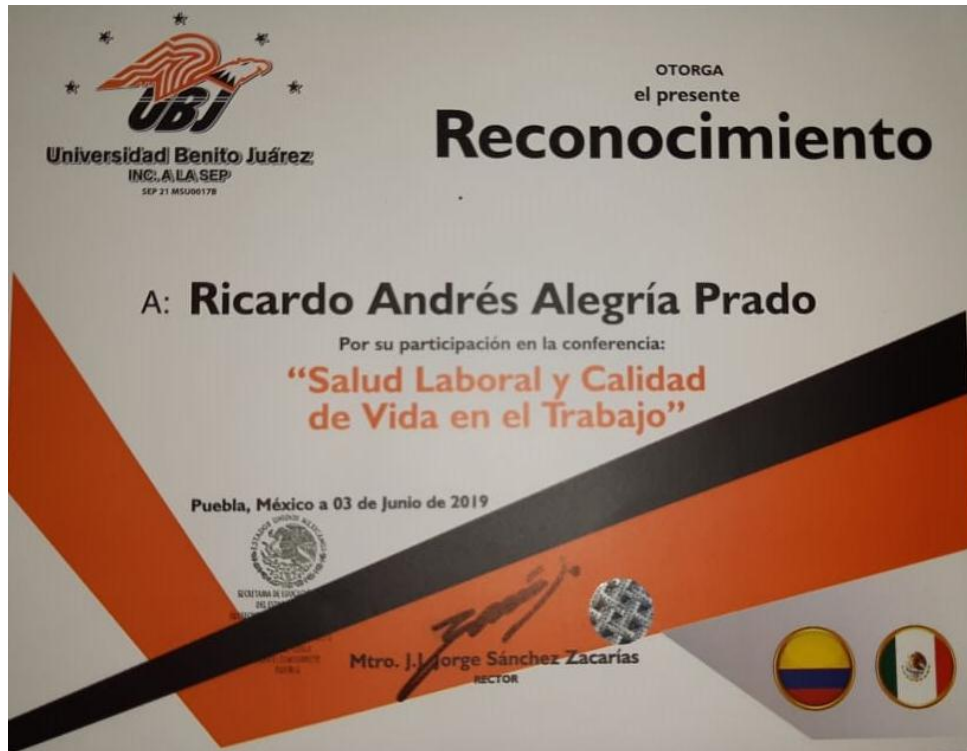
Ilustración 6. Reconocimiento Universidad Benito Juárez.