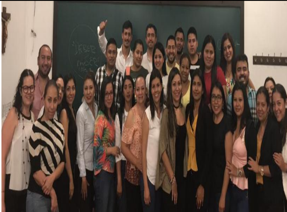
Ilustración 11. Visita Universidad Panamericana.