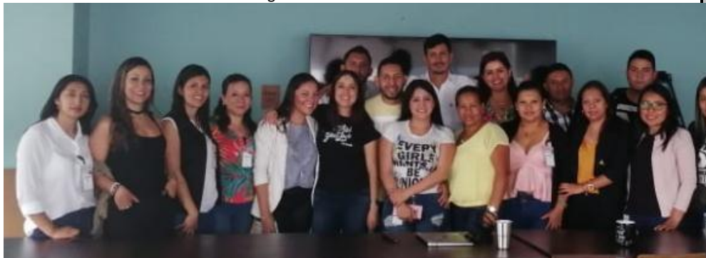
Ilustración 10. Visita empresa We work.