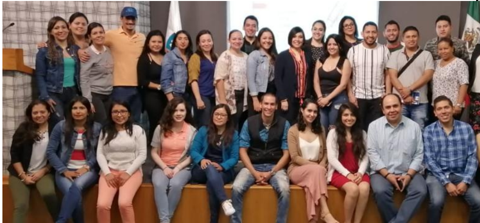
Ilustración 9. Visita Universidad Pedregal.