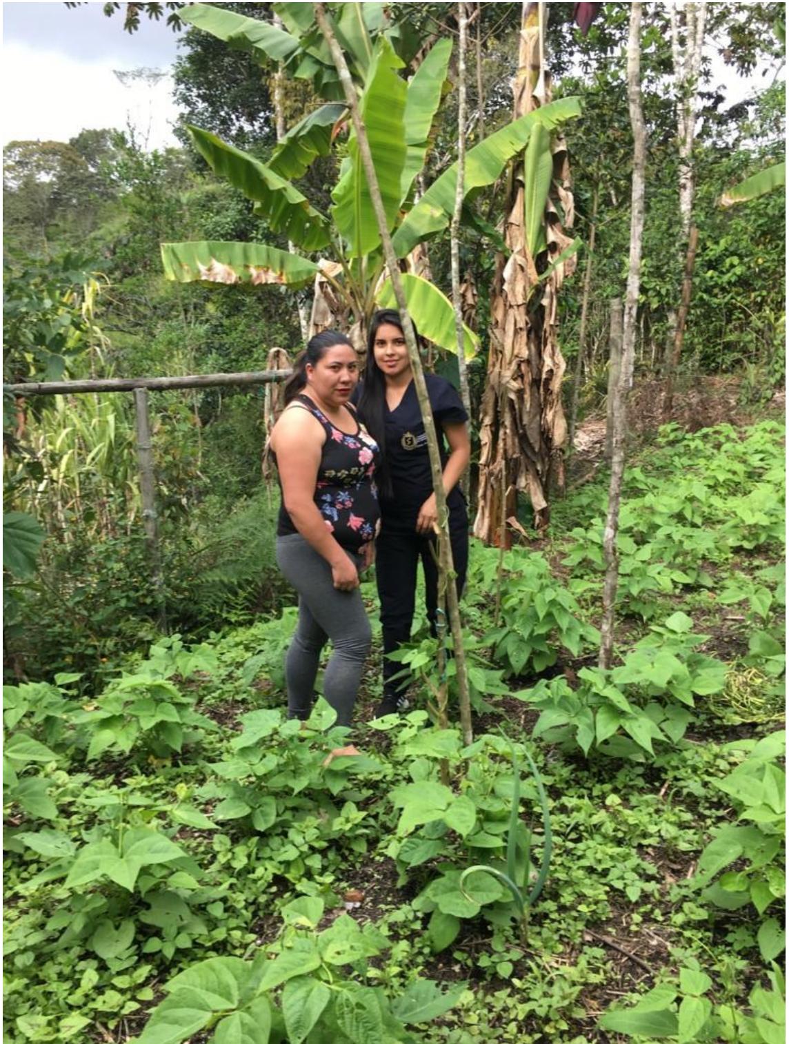
Cultivos como el frijol, hortalizas y otros son los que predominan en la vereda, en su mayoría son de pancoger.