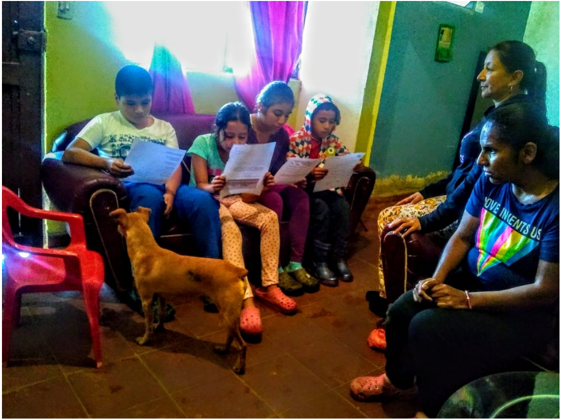
La participación de los niños fue fundamental, quienes contribuyeron a alimentar la información requerida para el estudio.