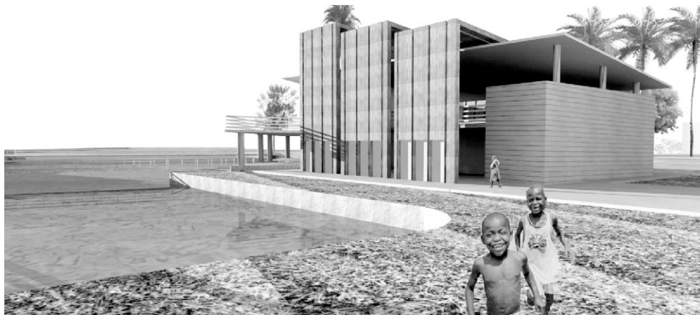
Imagen 1 Propuesta FUP

Desarrollar un prototipo de vivienda para frentes marítimos, que permita adaptarse a las consecuencias del cambio climático, en este caso, fenómenos como el incremento de los niveles marítimos y como los tsunamis, buscando a su vez que poco a poco estas vivienda, pueda empezar a remplazar a las existentes, que son vulnerables y no adaptadas a los fenómenos asociados al cambio climático 3 .