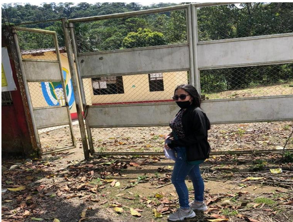
Anexo fotográfico 4: Visita a la IER. San José del Pepino.