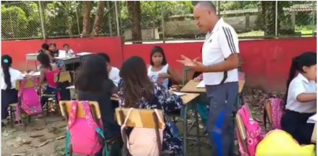
Anexo fotográfico 8: Miembros de la comunidad de Nueva Betania y participantes de la población sujeto.