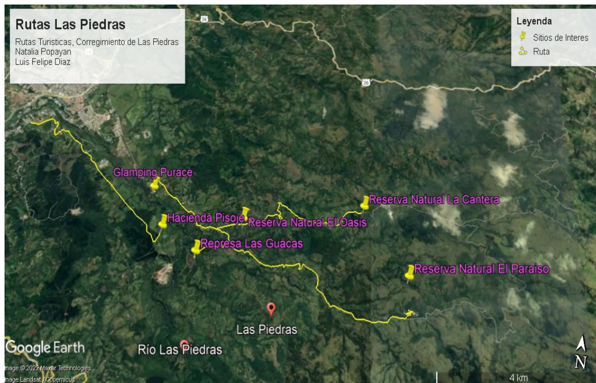
Imagen 3. Rutas Turísticas Mpio. De Las Piedras. Elaboración propia.

Encontramos 6 sitios de interés dentro del corregimiento de las Piedras, con vocación ambiental, (imagen 3) se tiene la Reserva Natural El Oasis con 5 km desde la penitenciaría de San Isidro, la reserva natural El Paraiso con 15 km desde la penitenciaría, la Reserva Natural La cantera con 5 km desde la Reserva Natural El Oasis y la Represa Las Guacas con 6.2 km desde la Reserva Natural El Oasis, para un total de 26 km aprox. de recorrido con vocación ambiental.