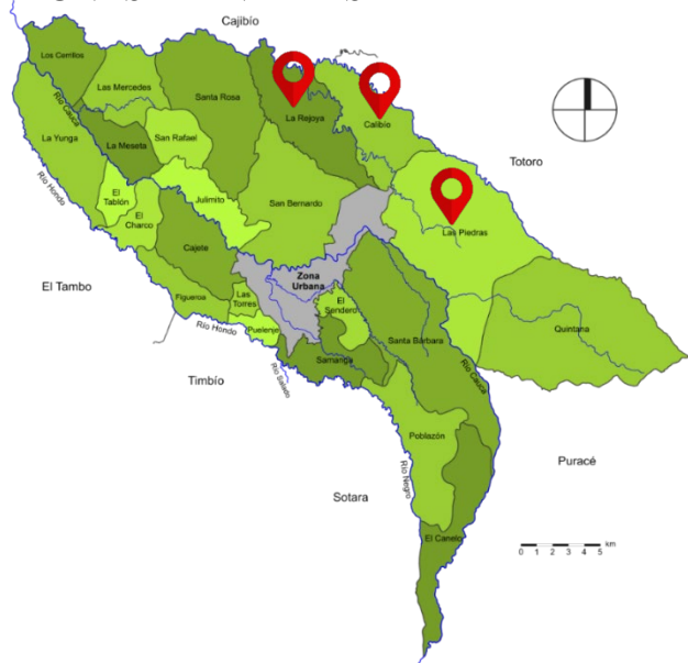
Imagen 1. Zona rural de municipio de Popayán. Zonas de Interés.