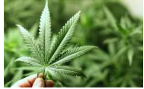
Figura 19. Cannabis