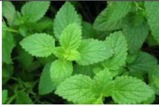
Figura 6. Menta, tomada de la página: https://www.bezzia.com/mejores-usos-medicinales-la-menta/