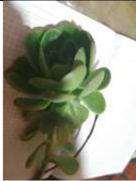
Figura 8. Orejuela