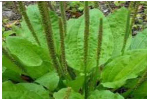
Figura 14. Llantel