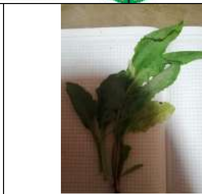
Figura 13. Diente de león