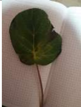
Figura 10. Hoja de paño