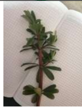
Figura 7. Siempreviva