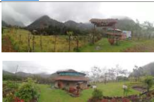
Figura 22. Asociación jardín botánico las delicias