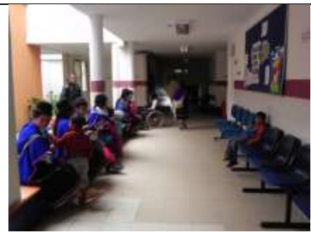
Figura 23. IPS Mama Dominga – atención con medicina occidental.