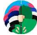
Tabla 1. Guía trabajo