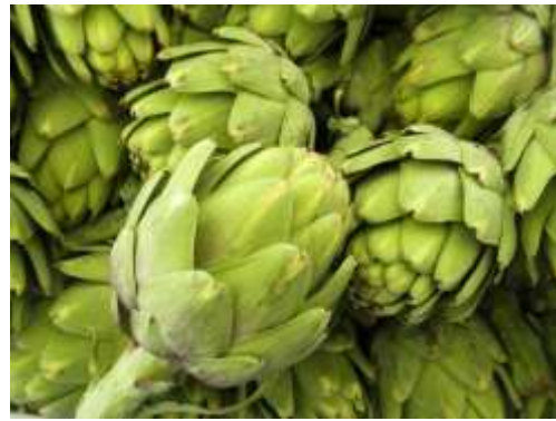
Figura 20. Alcachofa