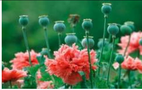
Figura 18. Amapola