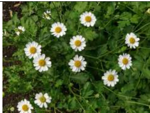
Figura 16. Altamisa