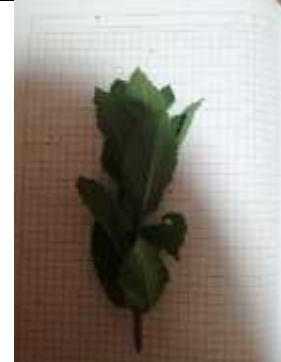
Figura 11. Yerbabuena