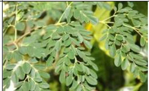
Figura 15. Vidavida, tomada de la página: https://hotelvillakitzi.com/moringa-la-planta-de-la-vida-y-eterna-juventud/