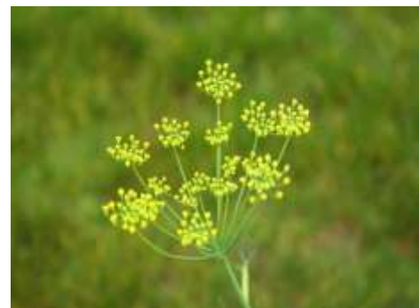
Figura 17. Hinojo, tomada de la página: https://www.remedios-naturales.org/hinojo/