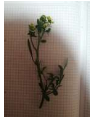
Figura 9. Ruda