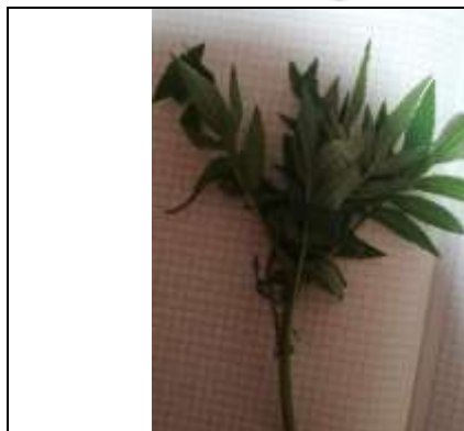
Figura 12. Gallinazo