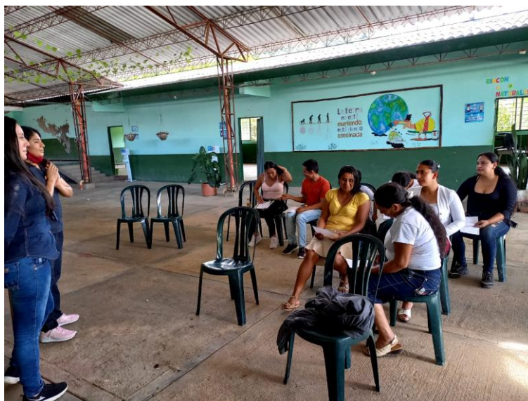
Imagen 2. Entrevista con padres de familia.

Con respecto a los interrogantes ¿Qué es para usted el compromiso familiar? y ¿Cómo considera que se establece dentro del grupo familiar?, destaca que PF1, PF3, PF4 y PF5 asumen que “la relación dentro del grupo familiar es buena y estable”; basada en la comunicación y el cumplimiento de los roles asignados. Se evidencia igualmente, que el compromiso de los padres hacia sus hijos se refuerza con el aprovechamiento del tiempo para la realización de tareas escolares. No obstante, PF5, cuando se le preguntó por la manera como corrige a sus hijos, señaló lo siguiente: “se corrige por medio de castigos, se le quita el celular, no se deja jugar con lo que más le gusta. Se habla y se explica el porqué del castigo y como mejorar por lo que se castigó”. (Ver figura 2. Entrevista con padres de familia).