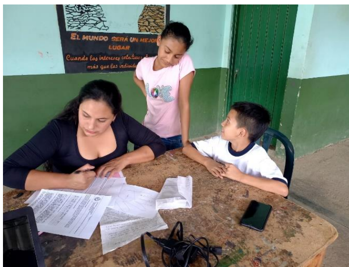
Imagen 3. Entrevista con los estudiantes.

Es decir, hay una aceptación “histórica en cuanto al castigo físico como herramienta para corregir comportamientos no deseados, donde padres y madres lo ejercen en la mayoría de los casos y en algunos se extiende también a otros miembros de la familia” (p. 11). El castigo como práctica moderada de corrección se emplea usualmente con fines morales, y no se asocia al maltrato sino en función de hacer “personas de bien”. Ideal que perdura hasta el presente en el contexto cultural urbano y rural. (Imagen 3. Entrevista con los estudiantes).