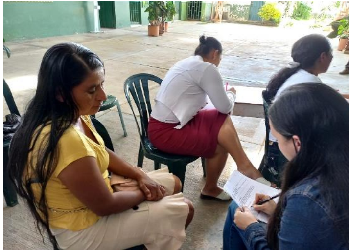
Imagen 1. Entrevista a padres de familia.