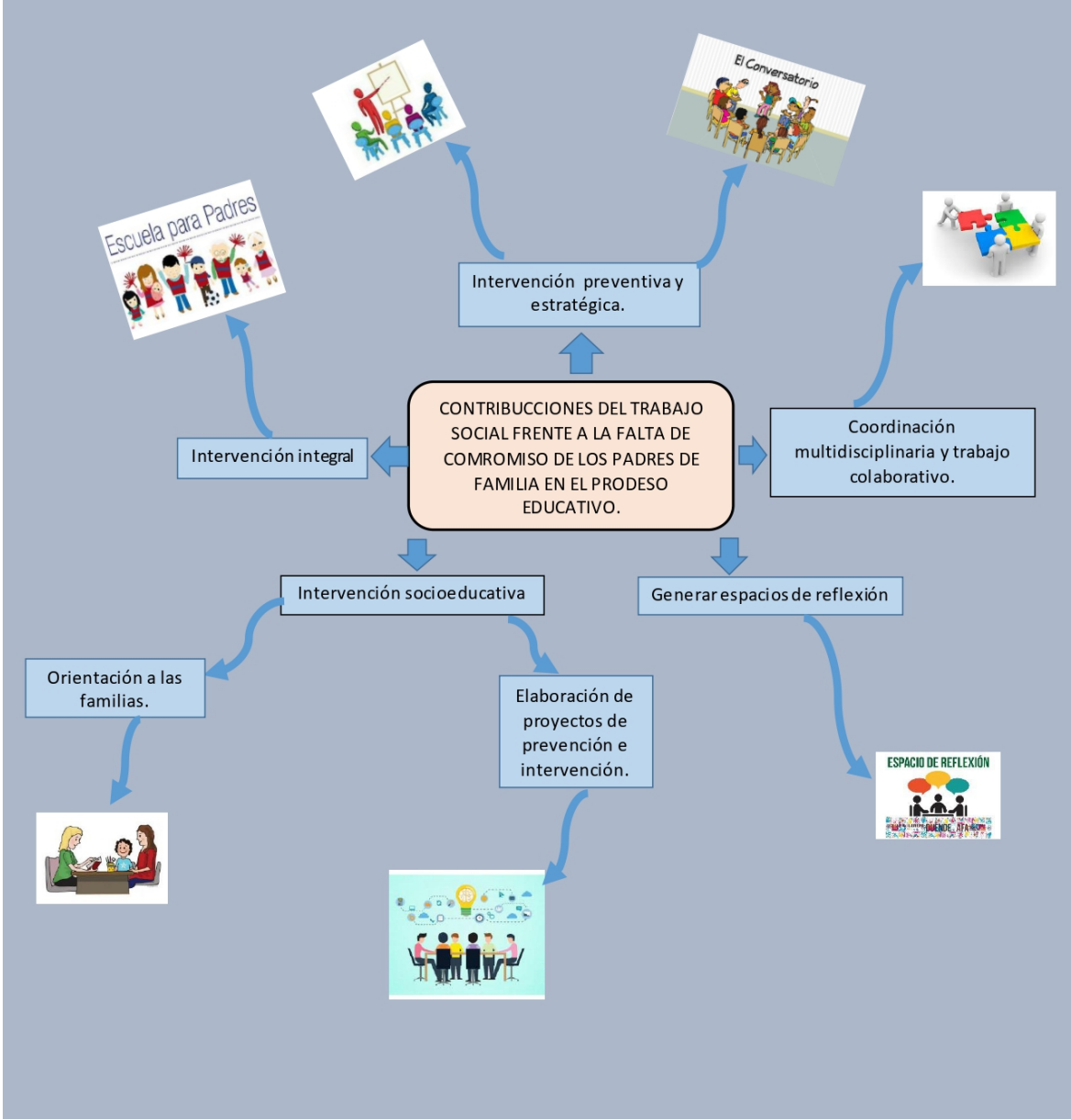
Imagen 4. Ruta de atención y participación de los padres de familia

trabajo colaborativo o en red dentro de las instituciones educativas, promoviendo la permanencia y el adecuado desarrollo de los niños y niñas en edad escolar.