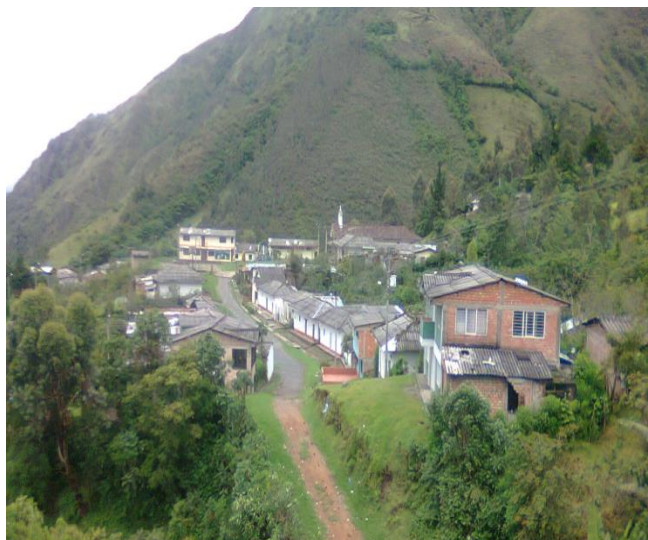
Figura 2 Imagen panorámica de la vereda Polindara