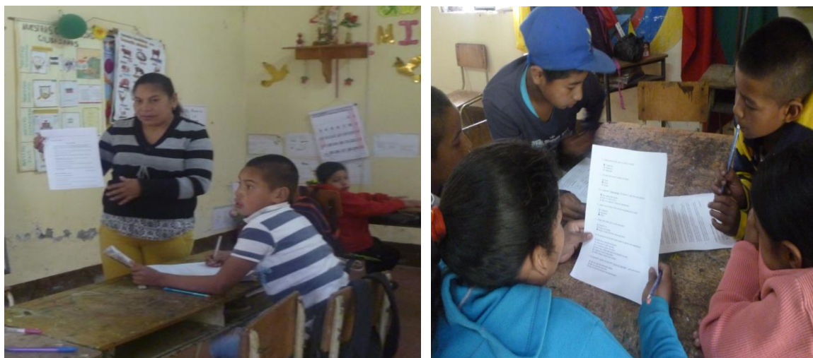
Figura 7 Fotos taller 2 Leer y comprender con el profe si se puede aprender