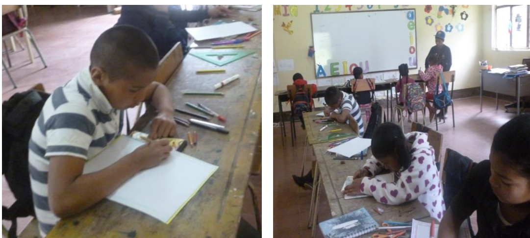
Figura 6 Fotos taller 1. Escuchando y pintando mi motivación voy mejorando