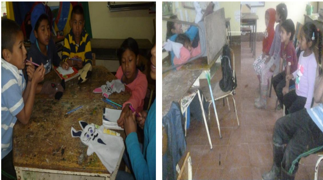
Figura 9 Fotos taller 4. Uno, dos tres con la artística es fácil comprender