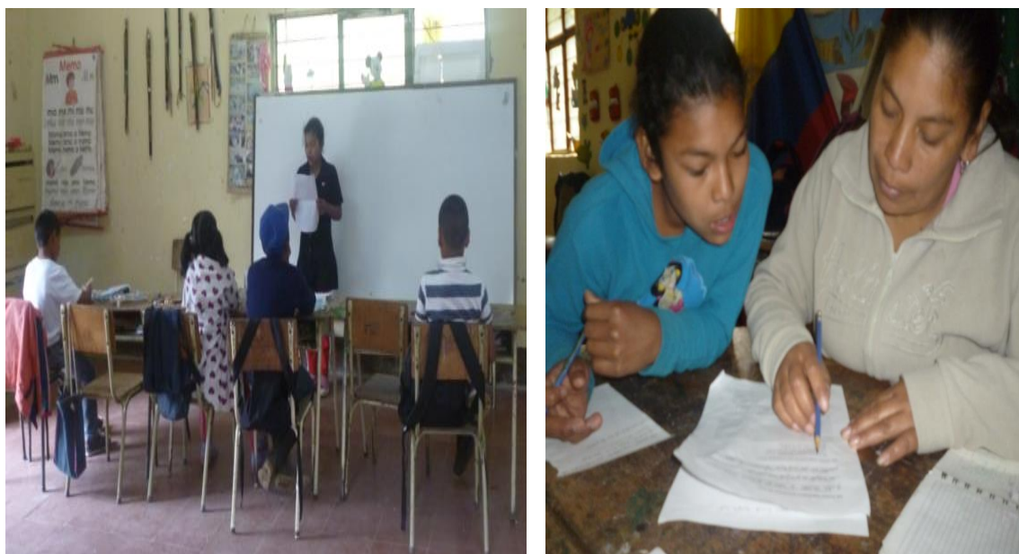
Figura 8 Fotos taller 3. Comprensión y comunicación dos factores de educación