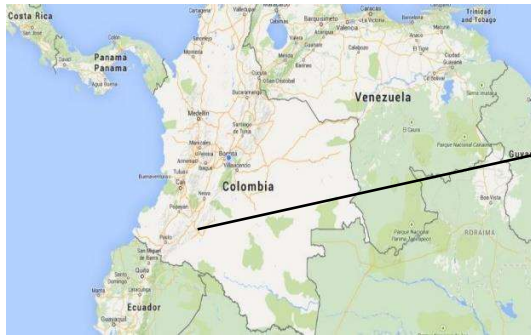
Mapa Colombia. Web.Google Maps, 25 Agosto 2018