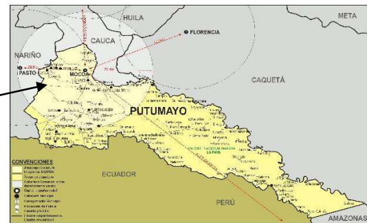
mapaputumayo.hugosalamancaparra.net. Agosto 2018 8

Colombia se ubica al noroeste del continente de América del Sur, con una extensión terrestre de 1'141.748 Km 2 . El país está dividido en 32 departamentos y un distrito capital (Bogotá), además de contar con seis regiones: Andina, Caribe, Orinoquía, Pacífica, Amazónica e Insular. Una parte de Colombia que geográficamente está ubicada en el departamento del Putumayo la cual se ubica al suroeste del país en la región de la Amazonía con una población de 345.204 habitantes, este departamento está dividido en 13 municipios y 2 corregimientos 9 .