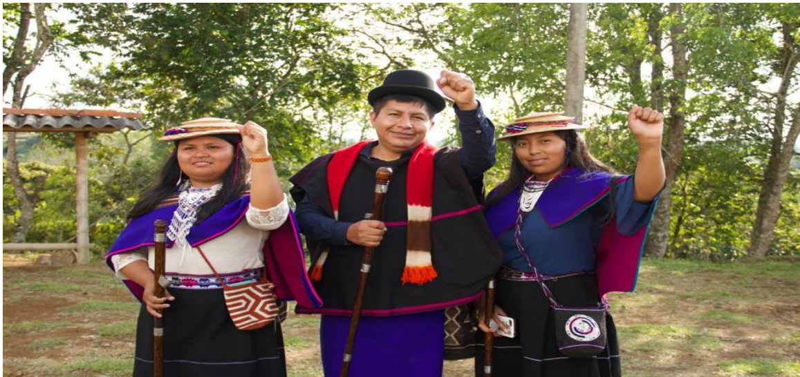
Pueblo Indígena Misak

Nota: La imagen representa a comuneros del pueblo indígena misak, donde se puede visualizar sus trajes tradicionales