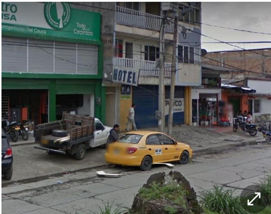
Figura 3. Hotel principal donde se realiza el trabajo sexual

Normalización del trabajo sexual en el barrio