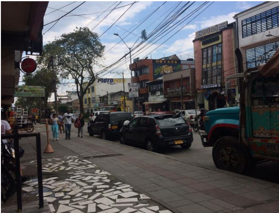
Figura 2. Calle principal de la zona

“Tiene muy buena importancia (refiriéndose al barrio), a nivel comercial una Central de Abastos como es la galería y la Esmeralda, aparte de eso hay muchas oficinas del sector financiero y un cementerio central importante; aparte es uno de los más antiguos de Popayán.” (P2, E2)