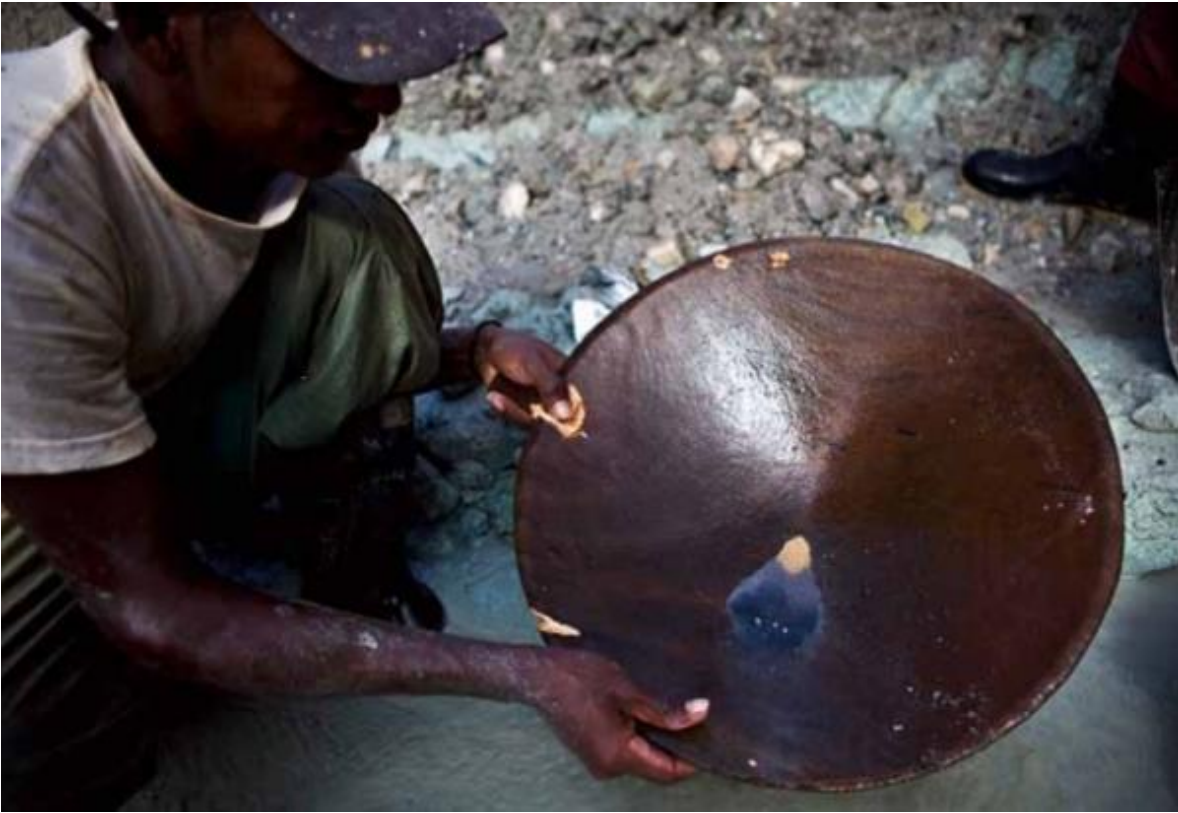
Fotografías 4, 5 y 6 Minería Tecnificada, ( o a gran escala) corregimiento de Chete.