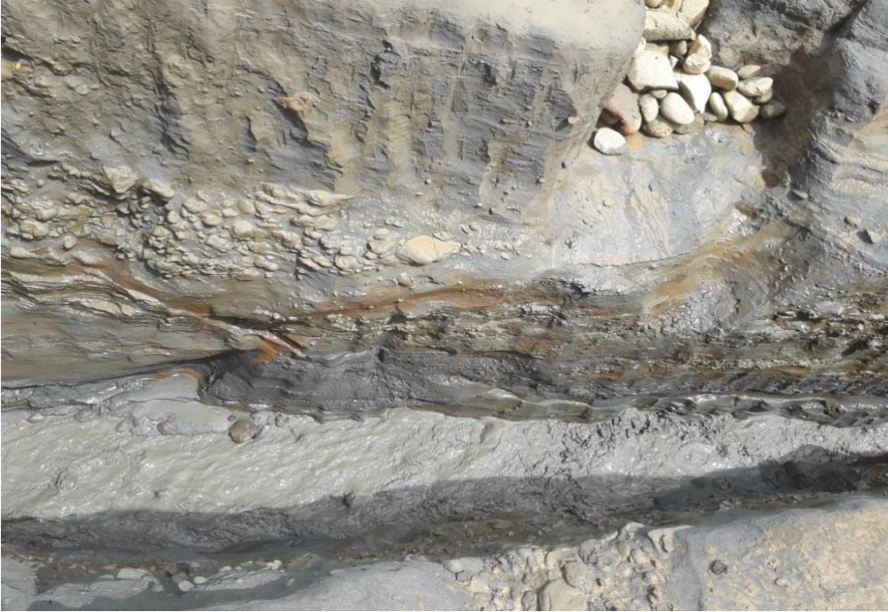
Fotografía 1, 2 y 3 mina en el corregimiento de Chete, ( ARTESANAL)