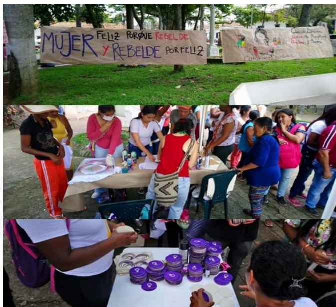
CONMEMORACION, MES DE LA MUJER (SANTANDER DE QUILICHAO)