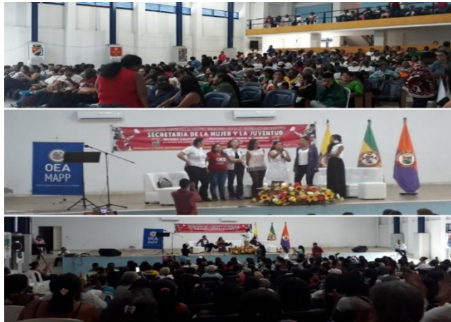
FORO- PARTICIPACIÓN POLITICA DE LAS MUJERES NORTECAUCANAS (CALOTO CAUCA)