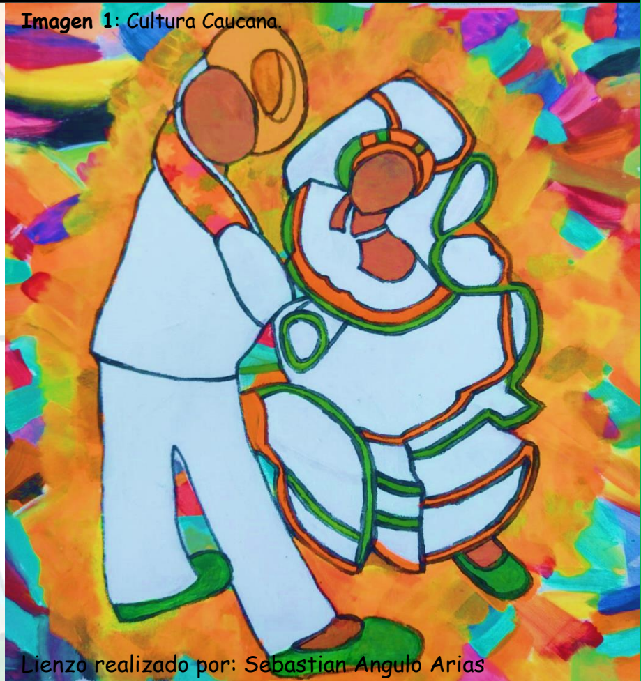
Imagen 1: Cultura Caucana.

Lienzo realizado por: Sebastian Angulo Arias