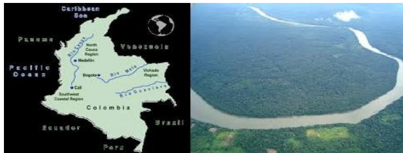
Imagen 9. Riqueza hidrográfica colombiana

Hidrográficamente Colombia constituye en el tercer país más rico en recursos de agua, con dos vertientes hídricas la Atlántica y la Pacífica, destacadas por ríos de gran importancia por sus caudales y amplitud de recorrido como lo son: los ríos Magdalena, Cauca, Sinú, Arauca, Meta, Vichada, Caquetá, Caguá, Baudó, Patía y San Juan.