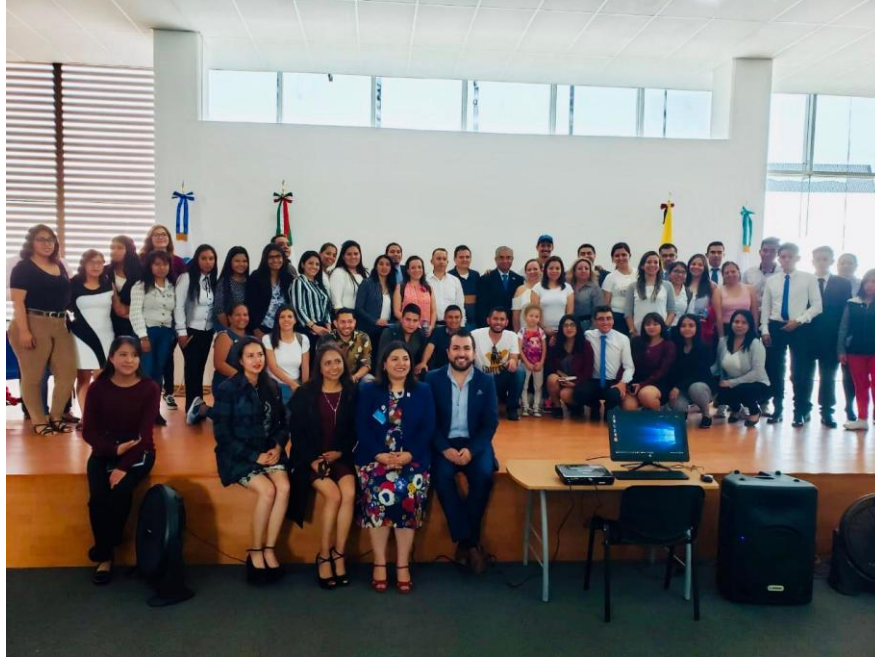
Imagen 17. Centro Universitario Iberoamericano De Estudios Profesionales SECUIEP – Ciudad de México