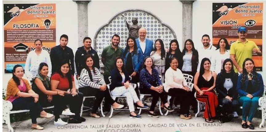
Imagen 19. Universidad Benito Juárez – Puebla