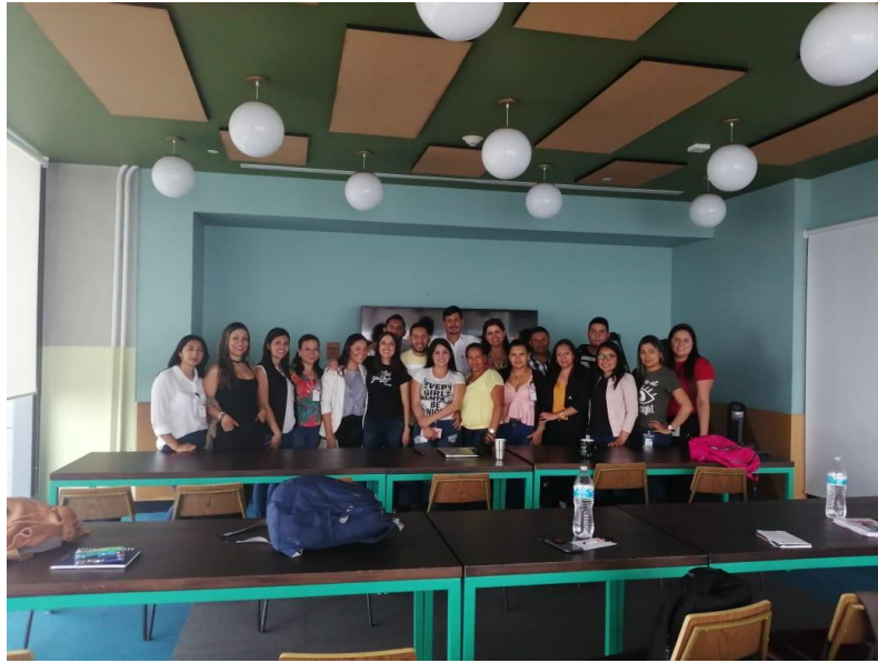
Imagen 23. Empresa de Servicios Multinacional – Wework – Ciudad de México