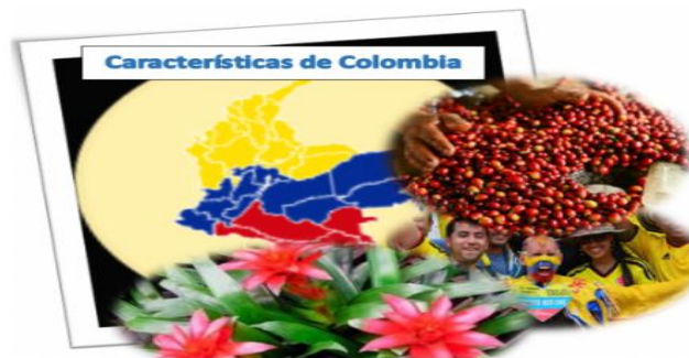
Imagen 7. Objetos representativos de Colombia

Las características de Colombia le hacen hoy en día uno de los destinos turísticos más importantes del mundo, siendo de manera generalizada su relieve, clima y ubicación geográfica, y sus gentes algunos de los puntos fijos que determinan la riqueza de su territorio, en cual actualmente es considerado como uno de los países de Suramérica con mayor nivel de recursos hídricos, de fauna y flora, de una reserva incomparable de bosques, paramos y un porcentaje significativo de