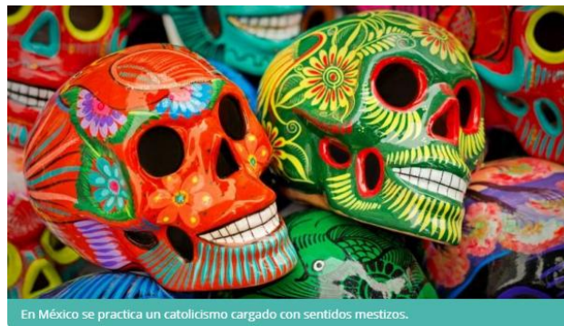
Imagen 6. Catrinas mexicanas

La cultura mexicana, como ocurre con numerosas naciones latinoamericanas, es fruto de un complejo proceso de sincretismo que combinó la tradición española católica mediterránea con las religiones y creencias aborígenes precolombinas, y parte de los aportes culturales africanos venidos al continente con los esclavos.