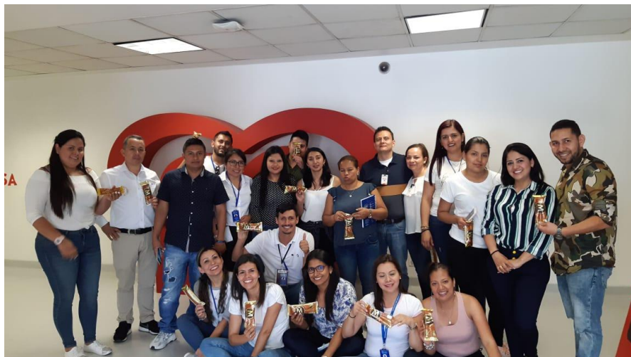
Imagen 22. Empresa Multinacional - Helados Holanda – Ciudad de México