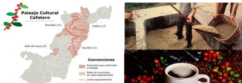
Imagen 14. El café colombiano gran motor económico

Sin duda alguna de las características que identificada Colombia es su economía basada en la producción y exportación del café, constituyendo esta actividad económica en una de las más importantes de sus habitantes.