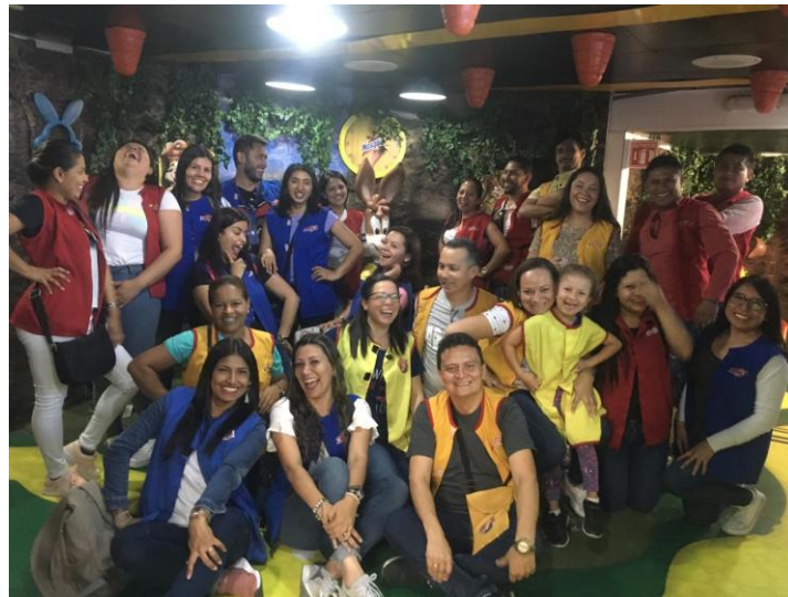
Imagen 24. Empresa Multinacional – Nestlé – Ciudad de México