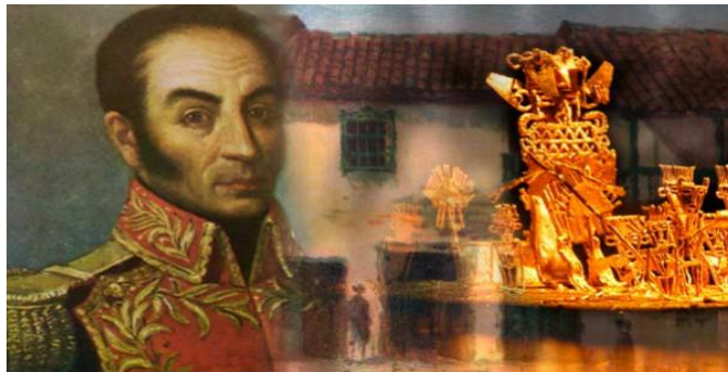
Imagen 15. Simón Bolívar

Mientras que los aztecas y los incas construyeron imperios que extendieron su control sobre vastas regiones de la América precolombina, Colombia fue colonizada por una serie de pequeños grupos de pueblos como el Tayrona y el Muisca. Justo antes de la llegada de los españoles, la zona se caracterizaba por comunidades que elaboraban una fantástica abundancia de la más fina orfebrería de América del Sur. Sin embargo un suceso dramático pronto cambiaría el curso de la historia de Colombia.