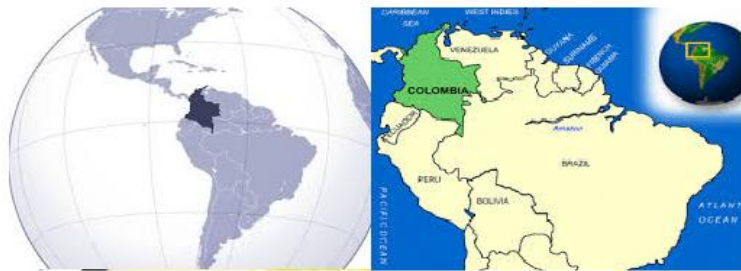
Imagen 8. Ubicación geográfica de Colombia

Colombia se encuentra ubicada en la parte noroccidental de América del Sur, en límites terrestres y marítimos con Venezuela, Brasil, Perú, Ecuador, República Dominicana, Costa Rica, Nicaragua, Honduras, Jamaica y Panamá, con salida a dos mares el Mar Caribe y el Océano Pacífico.