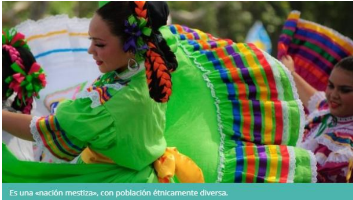
Imagen 4. Traje típico del folclor mexicano

México es el undécimo país más poblado del mundo, con alrededor de 119 millones de personas (censo de 2015). La densidad poblacional favorece enormemente a la metrópoli de la capital y su zona metropolitana, seguida por los estados de Puebla, México, Jalisco, Guanajuato y Chiapas.