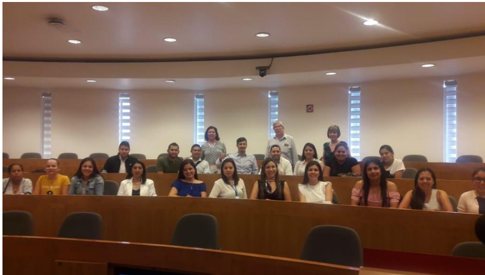
Imagen 18. Universidad Iberoamericana de Ciudad de México