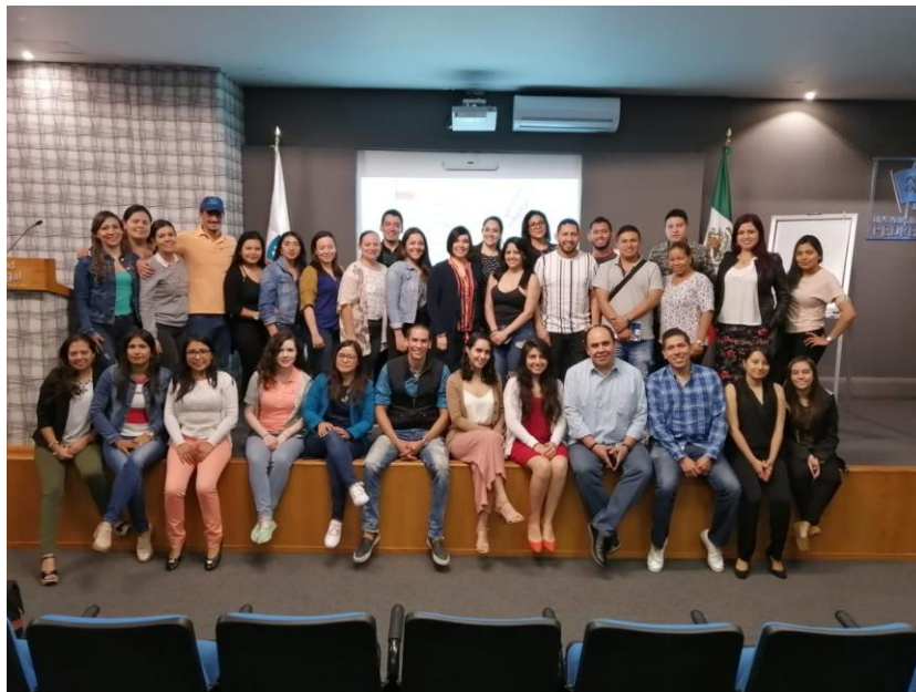
Imagen 20. Universidad de Pedregal – Ciudad de México