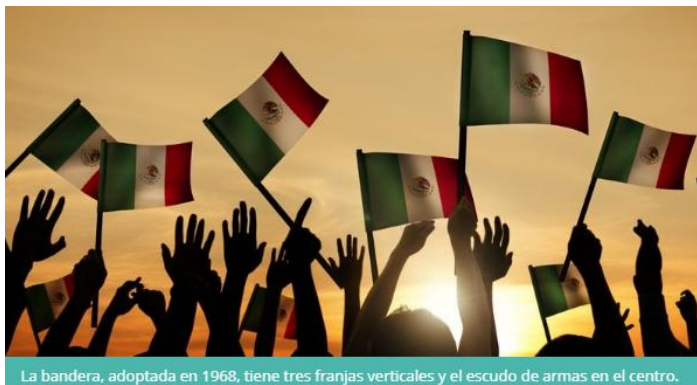
La bandera, adoptada en 1968, tiene tres franjas verticales y el escudo de armas en el centro.