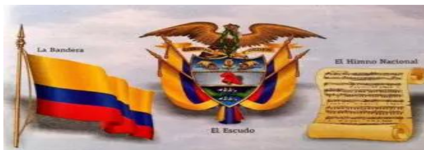
Imagen 12. Símbolos patrios colombianos