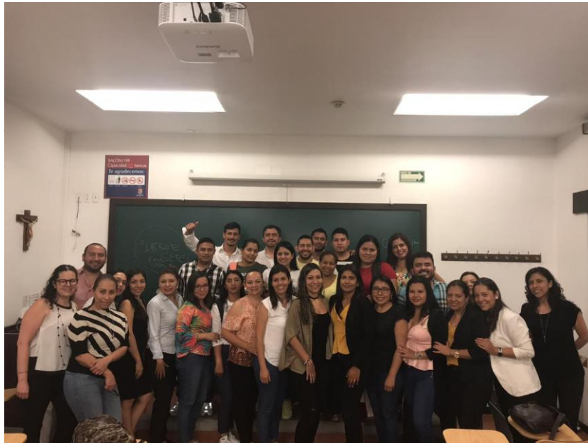
Imagen 21. Universidad Panamericana – Ciudad de México