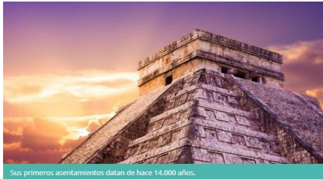
Imagen 5. Pirámide - cultura Maya en México

La historia mexicana comienza con los pobladores originarios de la región, cuyos primeros asentamientos datan de hace 14.000 años.