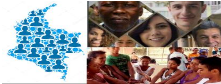
Imagen 13. La población colombiana

La población habitante de Colombia en su gran mayoría es de raza mestiza. Con un poco más de 49 millones de ciudadanos el 49% son mestizos, 37% blancos, 10,6% afro, y un 3,4% indígenas. En su gran mayoría su gente se encuentran acentuada en las zonas urbanas, sin embargo existe una presencia significativa en lo rural. De su economía se calcula que en 30% pertenecen al estrato medio.