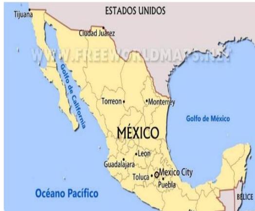
Imagen 2. Ubicación geográfica de México

La superficie total del territorio mexicano es de 1.964.375 km 2 , lo cual lo convierte en el tercer país más grande de América Latina y el decimocuarto más extenso del mundo. Casi toda esta superficie se halla en la placa norteamericana, junto con los EE.UU y Canadá, excepto la superficie insular mexicana (de 5.127 km 2 ).