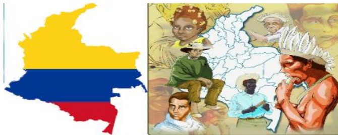
Imagen 16. Cruce de razas en la época colonial de Colombia

La riqueza cultural de Colombia se da en el momento del cruce de razas en la época colonial, donde indígenas, blancos y afros convergen en una mezcla donde nace una nueva raza y con ello el surgimiento de un grupo social mestizo que da pie a un sinnúmero de costumbres y culturas a lo largo y ancho del territorio colombiano.