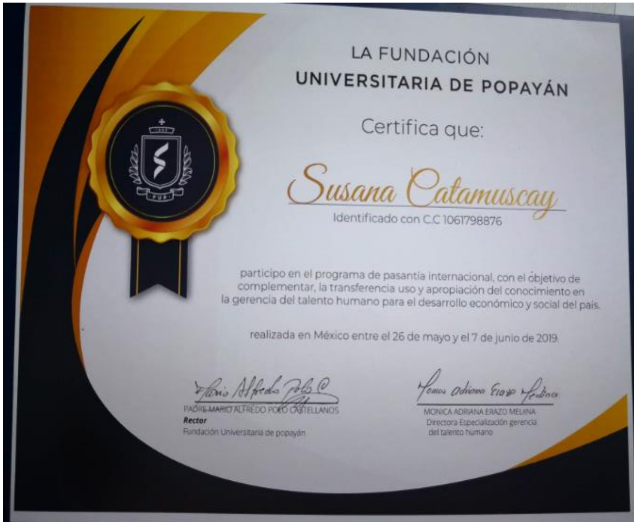
Ilustración 8. Certificado participación pasantía internacional.