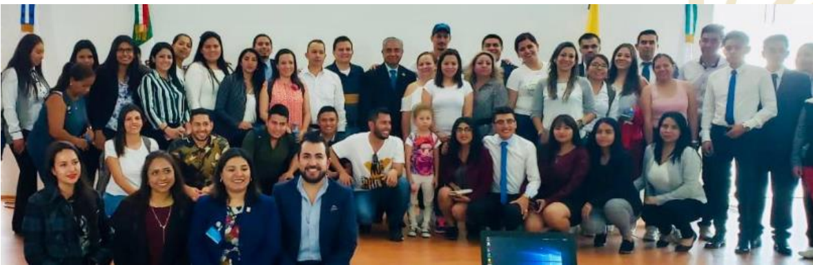
Ilustración 14. Universidad SECUIEP.