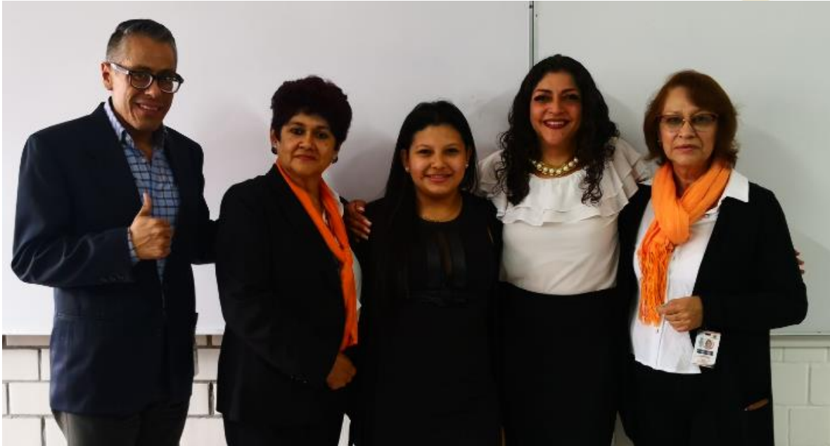
Ilustración 9. Conferencia Universidad Benito Juárez.