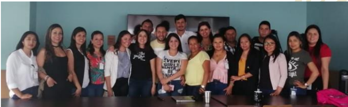
Ilustración 12. We Work. Visita empresarial.