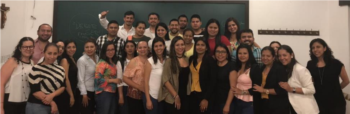
Ilustración 13. Visita Universidad Panamericana.