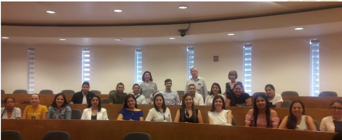
Ilustración 10. Conferencia Universidad Iberoamericana.