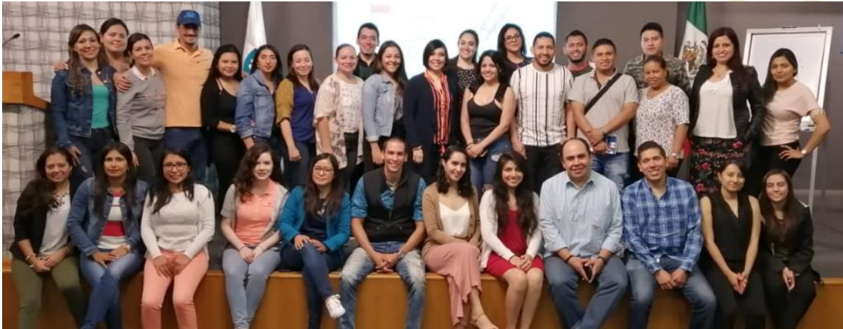
Ilustración 11. Visita Universidad Pedregal.