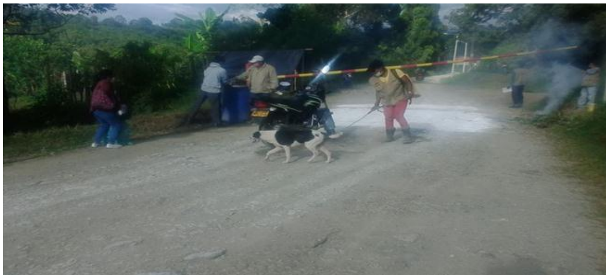
Figura 2. Ordeurca Cna Cauca. [Facebook page]. Facebook. (23 de abril de 2020). Recuperado de: shorturl.at/zEJZ7