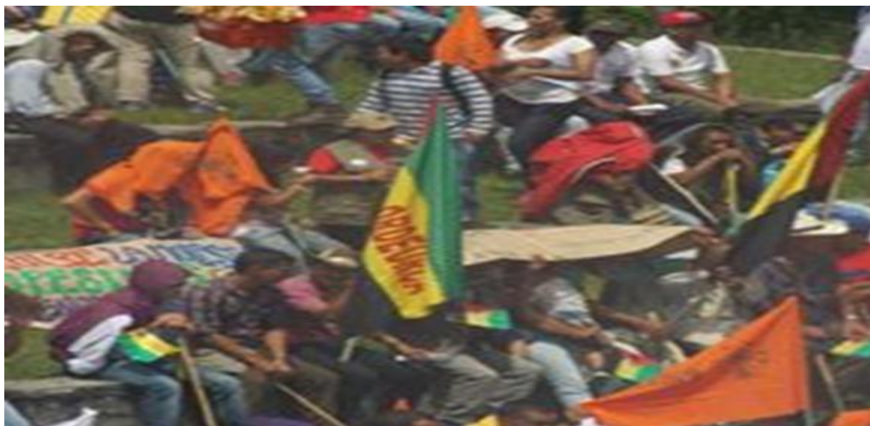
Figura 7. Ordeurca Cna Cauca. [Facebook page]. Facebook. (24 de noviembre de 2014). Recuperado de: shorturl.at/eiBUX

respetara la paz y que esas son unas actividades que estuvimos en la vía, las exigencias últimas digamos de Derechos Humanos que han sido grandes para todo el nivel de asesinato que se han vivido hoy en el departamento. (sujeto 1, entrevista personal, 14 de marzo del 2020)