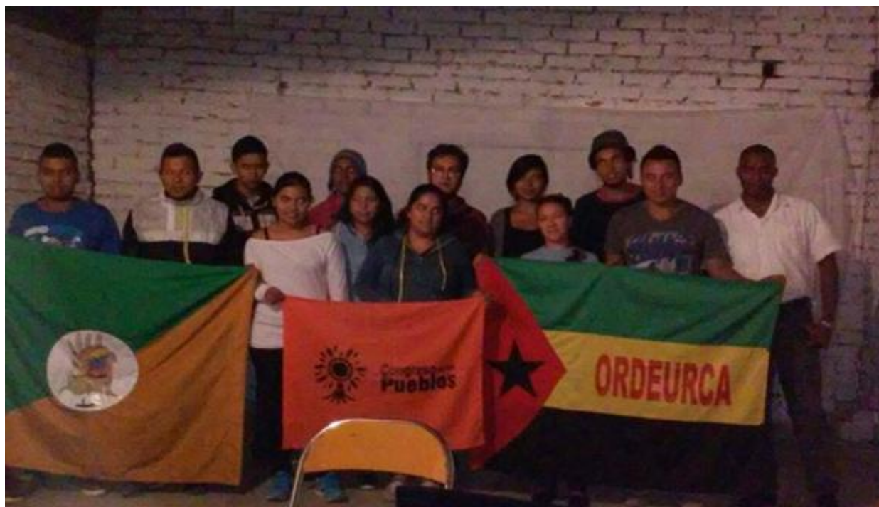
Figura 3. Ordeurca Cna Cauca. [Facebook page]. Facebook. (22 de julio de 2015). Recuperado de: shorturl.at/BJNRX