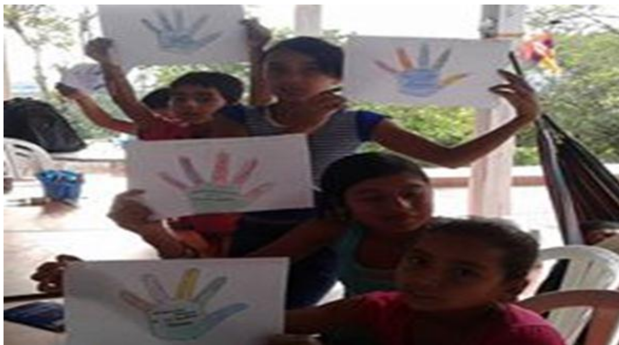
Figura 4. Ordeurca Cna Cauca. [Facebook page]. Facebook. (27 de junio de 2015). Recuperado de: shorturl.at/kmBK8

¿Que se logra?. Crear una conciencia de que existen diferentes métodos que se pueden utilizar para expresarse tanto lo que se piensa como lo que se siente, sin tener que recurrir a la violencia. Esto se puede ver reflejado en lo que comenta el sujeto 3 “tenemos compañeros que le estamos camellando al arte, estamos haciendo murales creando conciencia a través del arte y de muchas formas creamos conciencia y de muchas formas son esas acciones colectivas que tenemos” (sujeto 3, entrevista personal, 14 de marzo del 2020).