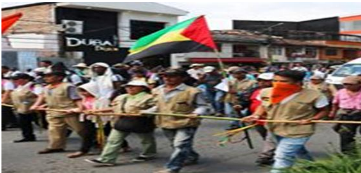
Figura 6. Ordeurca Cna Cauca. [Facebook page]. Facebook. (12 de octubre de 2017).