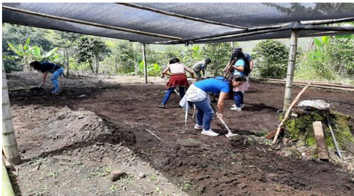
Figura 1. Vivero. Elaboración propia

¿Qué se logra? . Tener un mejor medio ambiente y fortalecer el trabajo en equipo, debido a que para construir un vivero se necesita de todos, como lo manifiesta el sujeto 1 “cuando uno trabaja con el campo pues uno es campesino se identifica mucho porque es de donde yo vengo y es el trabajo que a uno le gusta” (sujeto 1, entrevista personal, 14 de marzo del 2020).