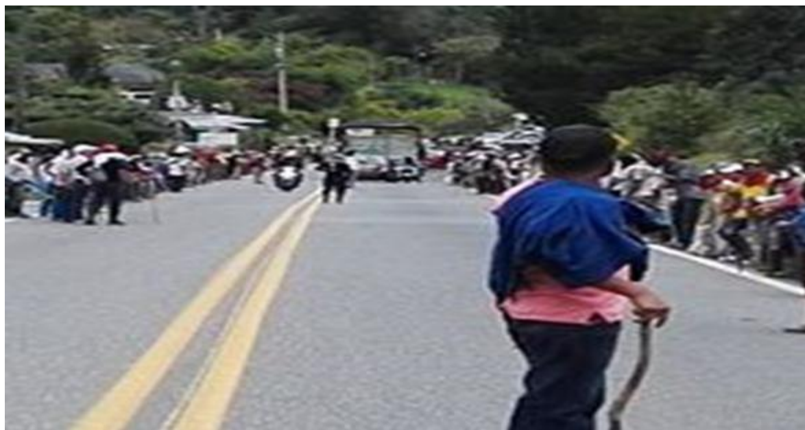
Figura 8. Ordeurca Cna Cauca. [Facebook page]. Facebook. (3 de junio de 2016). Recuperado de: shorturl.at/acqD5

Digamos es que las acciones colectivas que nosotros hacemos desde que tal vez nace ORDEURCA la movilización digamos no es para joder al pueblo porque sí, sino que es una necesidad porque ya no hay otras formas de hacerlo, entonces no somos escuchados y la única forma es ir a las vías y afectar la economía. (Sujeto 3, entrevista personal, 14 de marzo del 2020)