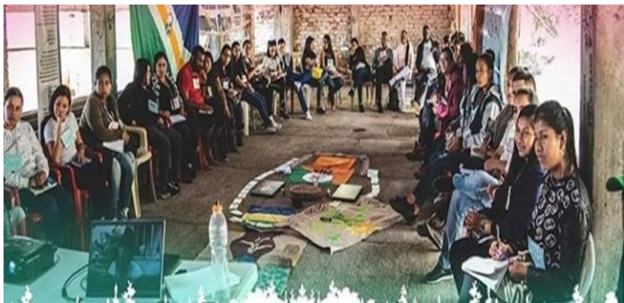
Figura 5.

¿Que se logra? . Que las mujeres adopten un pensamiento nuevo, un pensamiento emprendedor y con una visión futurista.